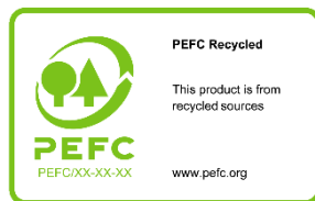
Tableau 2 : Aperçu des options d'utilisation de PEFC sur les labels de produits

7.1.2.2.1 Le label PEFC recyclé devra être utilisé lorsque le produit inclut uniquement de la matière recyclée (voir 3.15, définition de la matière recyclée ). Le nom du label est « PEFC recyclé » et le message du label : « [Ce produit] est issu de sources recyclées ». La mention [ce produit] peut être remplacée par le nom du produit certifié ou de la matière certifiée incluse dans le produit auquel le label fait référence, en utilisant le générateur de labels.